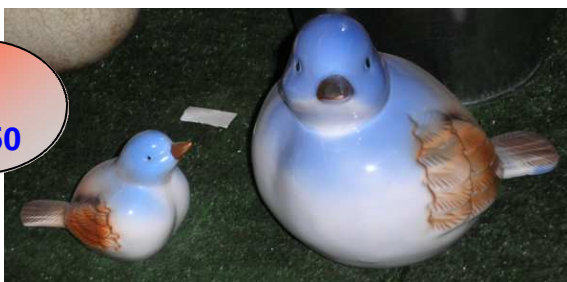
Keramikvogel „Gerda“ verschiedene Größen