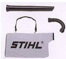
Anbausatz Saugereinrichtung Für STIHL BG 56, BG 86

Serienmäßige Ausstattung: Rund- und Flachdüse, Einhandbedienung, manuelle Kraftstoffpumpe, ElastoStart, Antivibrationssystem