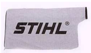
Staubreduzierender Saugsack Für STIHL SH 55, SH 56, SH 85, SH 86

Serienmäßige Ausstattung: komplette Saug- und Blaseinrichtung, Runddüse, Flachdüse, manuelle Kraftstoffpumpe, ElastoStart, Antivibrationssystem