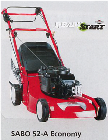
SABO 52-A Economy