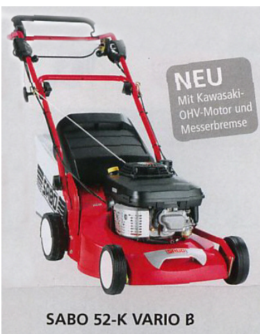
SABO 52-K VARIO B

Rasenmäher mit 52 cm Schnittbreite und variablem Fahrtrieb (2,7 - 4,3 km/h). Daher für das Mähen großer Rasenflächen geeignet. 4-Takt-Motor 5,5 PS , zentrale Schnitthöheneinstellung 5-fach (2,5-8,2 cm), Alu-Chassis , höhenverstellbarer Führungs-holm, Gewicht 44 kg, Fangsack 75 l, patentiertes SABO-TurboStar-System , empfohlene Rasenfläche bis 2000 m 2 . Auch zum Laubsaugen und Mulchen geeignet