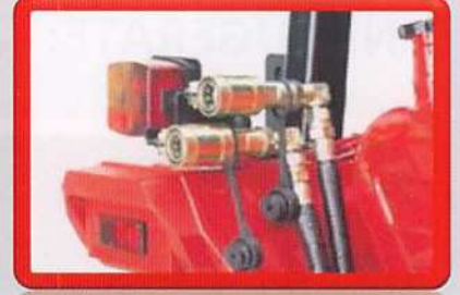
Steuerventil mit Hydraulikanschlüsse